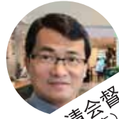
叶泉清会督 (异象分享)